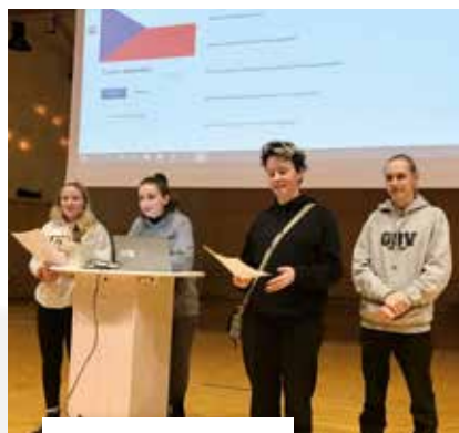
Några av eleverna från Břeclav höll i en presentation om Tjeckien och dess historia, kultur, mat etc

Ett av huvudmålen för projektet var att ta reda på hur industrier i de båda städerna hanterar miljöfrågor.