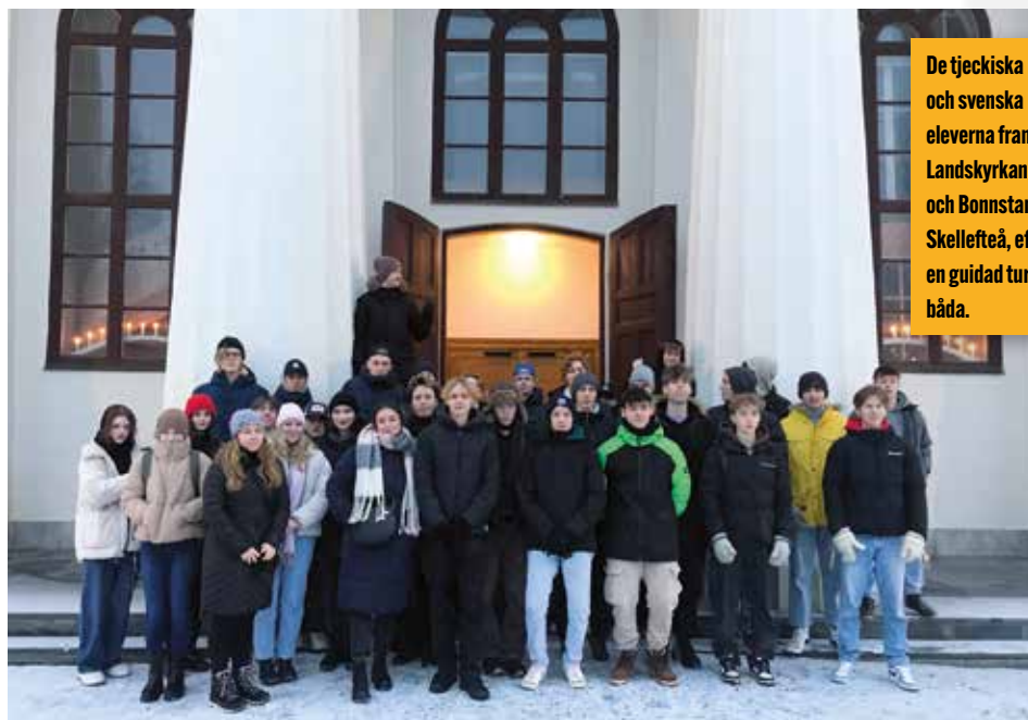
De tjeckiska och svenska eleverna framför Landskyrkan och Bonnstan i Skellefteå, efter en guidad tur av båda.