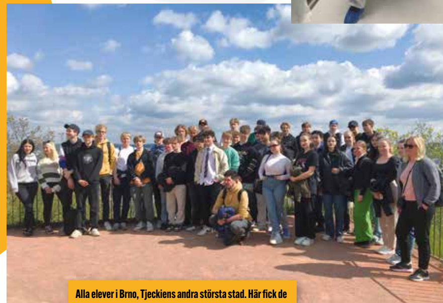
Alla elever i Brno, Tjeckiens andra största stad. Här fick de veta om slaget i Brno där svenskarna blev besegrade.