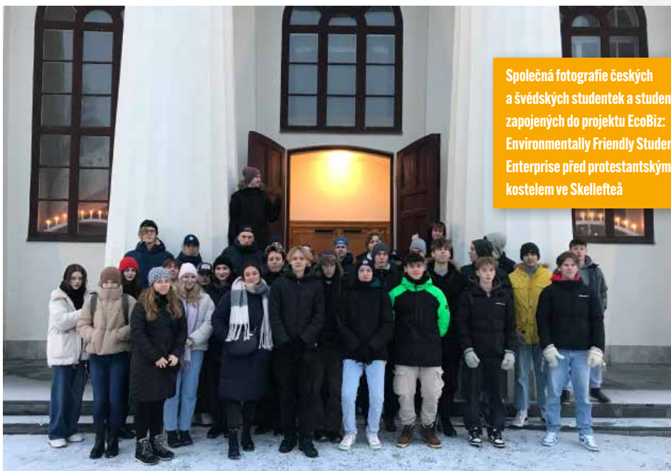
Společná fotografie českých a švédských studentek a studentů zapojených do projektu EcoBiz: Environmentally Friendly Student Enterprise před protestantským kostelem ve Skellefteå