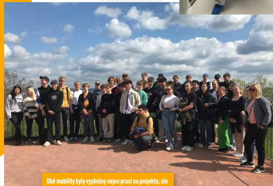
Obě mobility byly vyplněny nejen prací na projektu, ale také výlety. Se Švédy Češi vyrazili třeba do Brna.