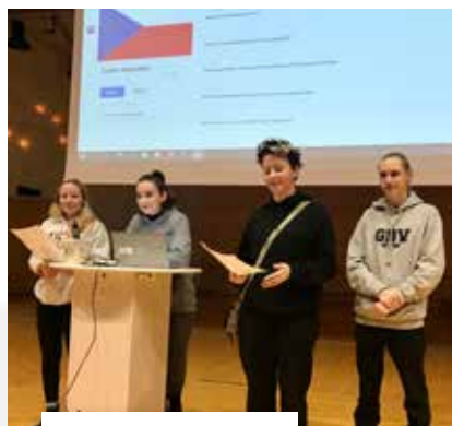
Studenti si kromě zkušeností s podnikáním vyměnili i informace o zemích a místě, odkud pocházejí.

Jedním z dílčích cílů programu bylo získat informace o tom, jak velké firmy řeší otázku ekologické udržitelnosti, a tím pomoci studentům porozumět, jaký vliv má ekologická udržitelnost na společnosti dnes a bude mít v budoucnosti.